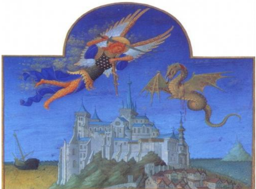
Произошла на небе война: Михаил и ангелы его воевали против